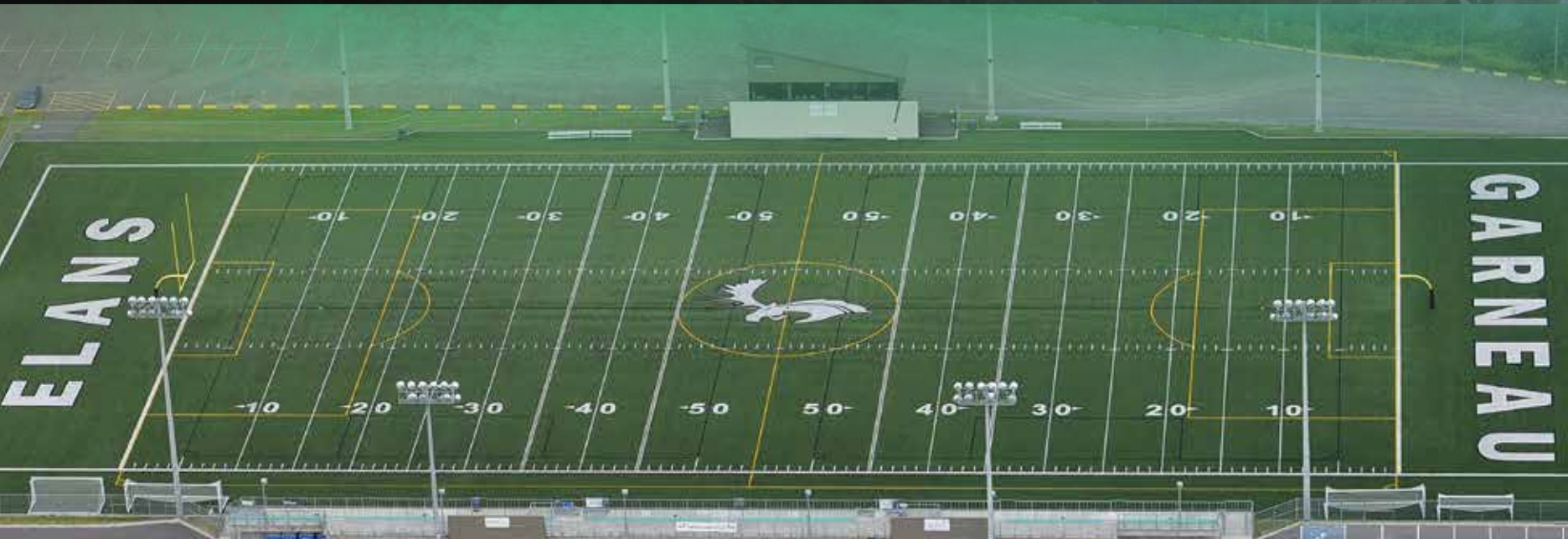
› Vue aérienne du stade

LE CÉGEP GARNEAU DISPOSE D'UN STADE EXTÉRIEUR POURVU D'UNE SURFACE SYNTHÉTIQUE ET DE GRADINS POUVANT ACCUEILLIR 2 000 SPECTATEURS.